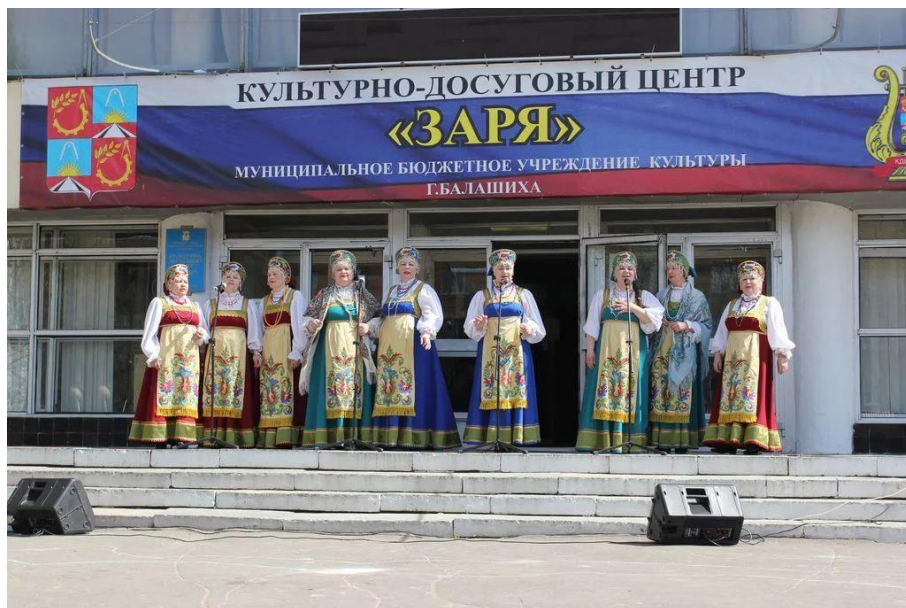
МБУК "КДЦ "Заря" Балашиха, микрорайон «Заря», ул. Ленина дом 6.